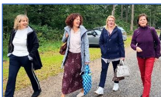
'Aan de slag met vakgenoten uit het onderwijs!'

Inmiddels namen meer dan 40 bestuurssecretaresses deel aan deze opleiding! Een impressie: