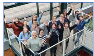
'Een waardevolle opleiding!'