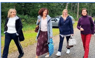
'Aan de slag met vakgenoten uit het onderwijs!'

Inmiddels namen meer dan 40 bestuurssecretaresses deel aan deze opleiding! Een impressie: