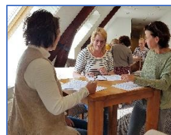
'Praktisch: je kunt er direct mee aan de slag!'