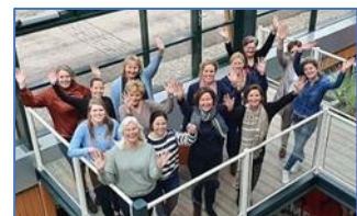
'Een waardevolle opleiding!'