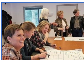
'Prettig om samen opdrachten te maken'